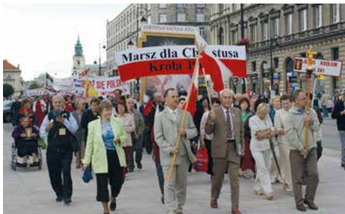
Marsz dla Jezusa Króla Polski; Warszawa 2010