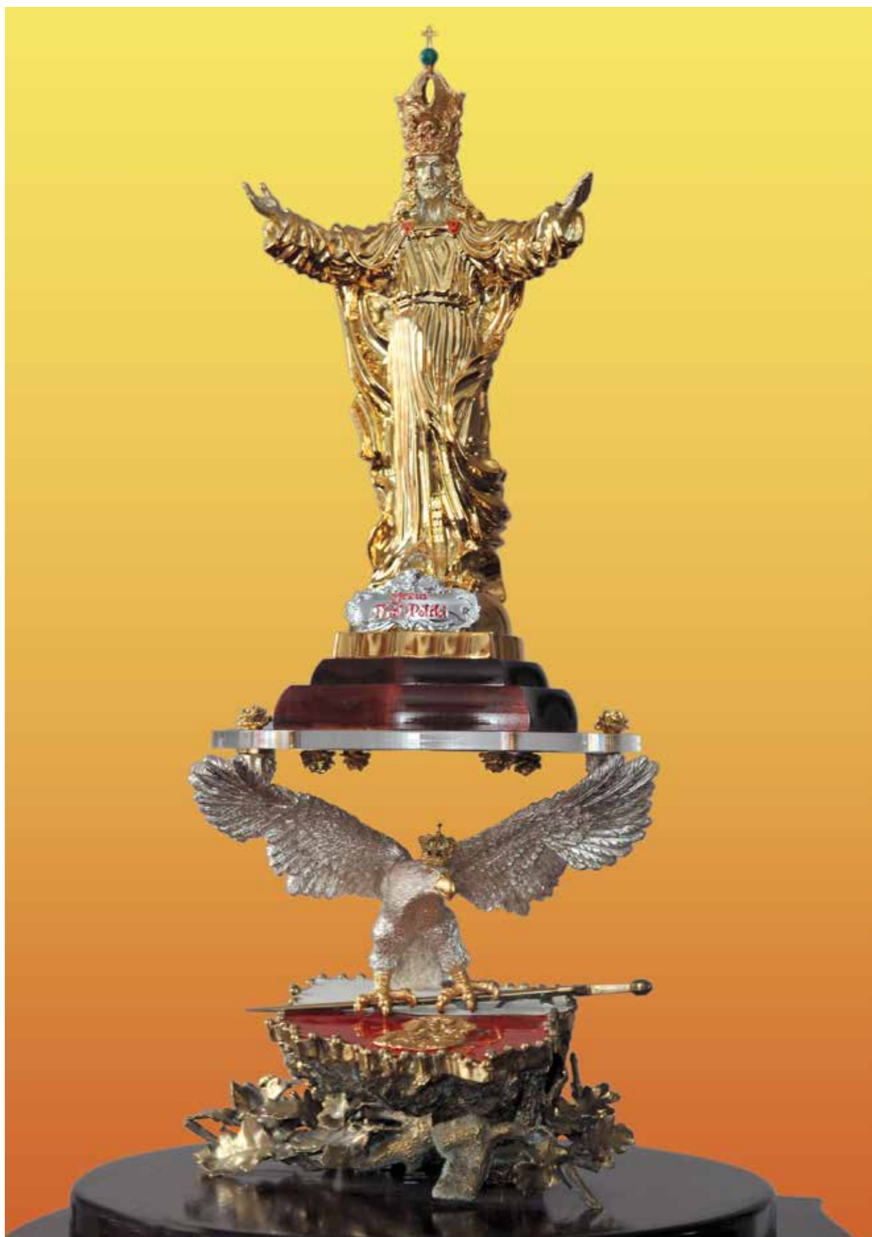
Feretron – Arka Jezusa Króla Polski – wykonany na Uroczystość Matki Bożej Królowej Polski w Częstochowie, 3.05.2011 r.