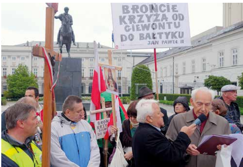
Marsz dla Jezusa Króla Polski; Warszawa 2015