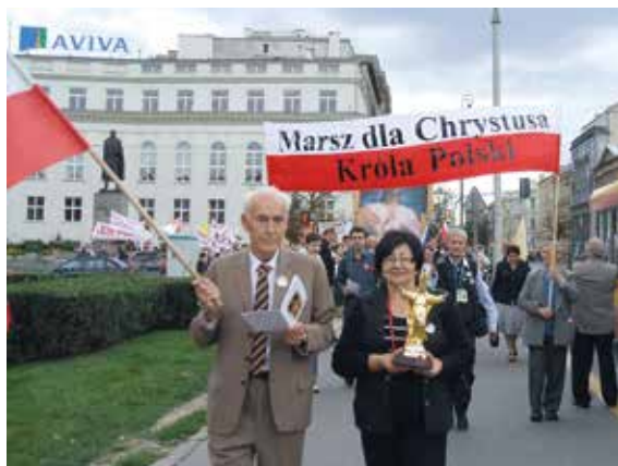
Marsz dla Jezusa Króla Polski; Warszawa 2009

Niech święci Aniołowie i święci Patronowie Fundacji Serca Jezusa i Stowarzyszenia „Róża”, św. Klaudiusz de la Colombière i Czcigodna Służebnica Boża Rozalia Celakówna, wyjdą Mu teraz na spotkanie w niebie, a Maryja Niepokalanie Poczęta niech Go zaprowadzi przed Tron Swojego Jednorodzonego Syna – Jezusa Chrystusa Króla.