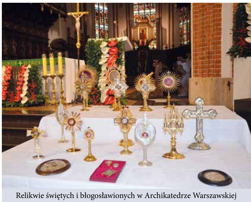
Relikwie świętych i błogosławionych w Archikatedrze Warszawskiej

Święty Ludwiku Maria Grignion de Montfort – módl się za nami Święty Ojciec Pio z Pietrelciny, stygmatyku; Święty Konradzie z Parzham, otwierający drzwi w niebie; Święty Antoni Padewski, patronie rzeczy zagubionych; Święty Maurze, uczniu świętego Benedykta; Święty Piotrze z Werony, męczenniku; Święty Kryspinie; Święty Krescencie; Święty Saturninie; Święta Małgorzato z Kortony; Święty Antoninie z Florencji; Święty Bazyli Wielki; Święty Aleksy; Święty Filipie Nereuszu, Święty Wincencie Ferreuszu; Święty Gerwazy; Święty Homobonusie, Święty Klemensie; Święty Janie Pustelniku; Święta Gertrudo Wielka; Święta Eutropio; Święty Andrzeju Avellino; Święty Janie z Cypru, patronie jałmużników; Święta Franciszko Rzymska